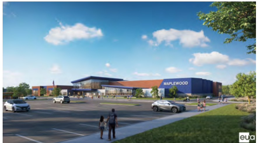
Representaciones del arquitecto del exterior de la escuela nueva.

Sostenibilidad: La nueva Escuela Maplewood será rentable, energéticamente eficiente y sostenible, al mismo tiempo que maximizará los recursos existentes.